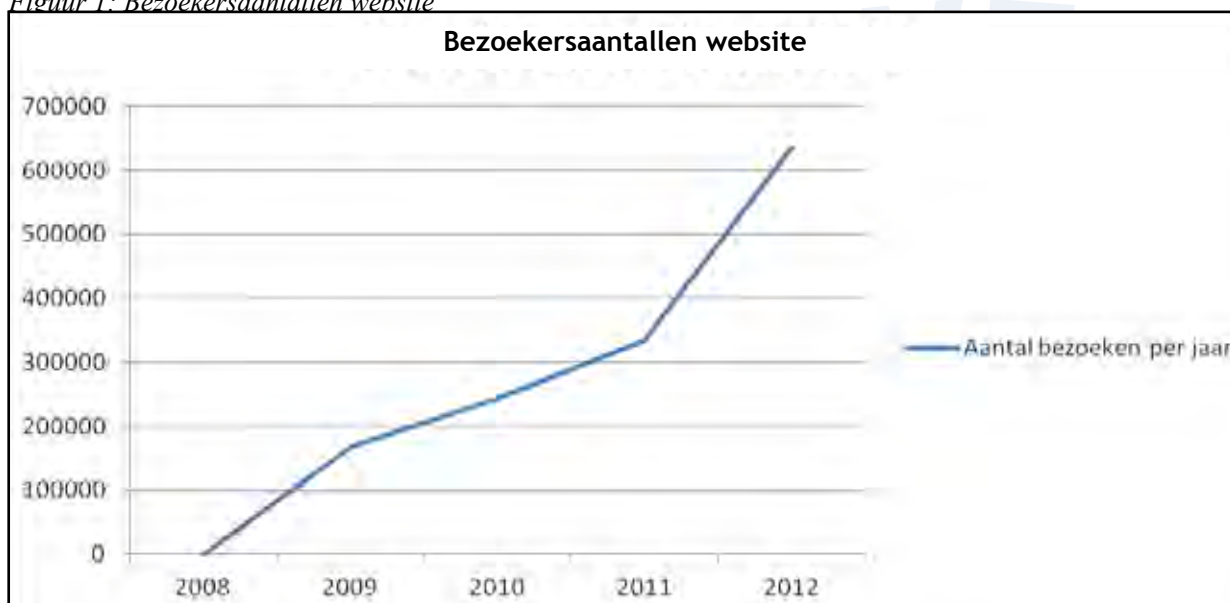
Figuur 1: Bezoekersaantallen website

Aanvullend op de media-aandacht geeft de Sophia-Vereeniging voorlichting via haar website. Deze wordt op continue basis geoptimaliseerd en aangepast aan de eisen van zoekmachinemarketing. Daardoor komt de Google Grant van $ 40.000,- per maand aan gratis online advertenties geheel ten goede aan de voorlichtende doelstelling van de organisatie. De website trok in 2012 een half miljoen unieke bezoekers en 635.000 bezoeken. In 2013 is het doel deze stijgende lijn vast te houden en de bezoekers nog beter te voorzien in hun informatiebehoefte.